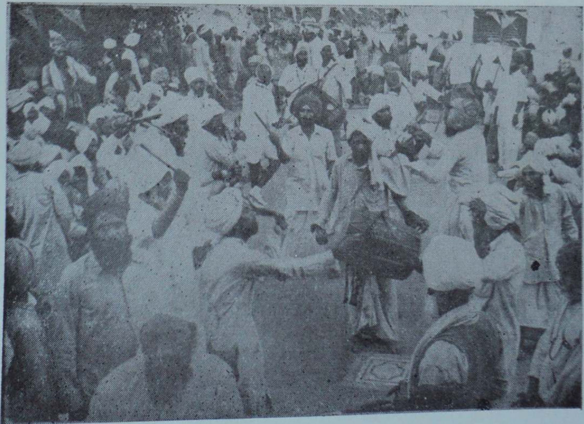
ਸ੍ਰੀ ਹਜ਼ੂਰ ਬਾਬਾ ਸਾਹਿਬ ਸਿੰਘ ਜੀ ਬੇਦੀ ਦੇ ਗੁਰਪੁਰਬ ਸਮੇਂ ਦਾ ਇਕ ਦ੍ਰਿਸ਼ ।