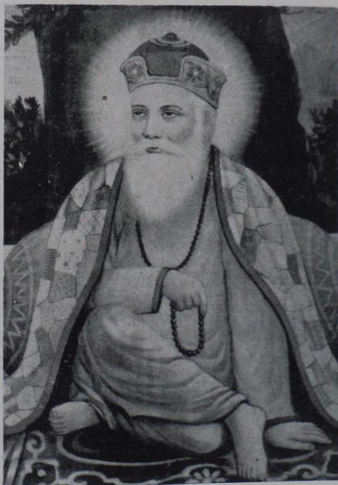
ਬੰਨ ਪੰਨ ਗੁਰੂ ਨਾਨਕ ਪਾਤਿਸ਼ਾਹ