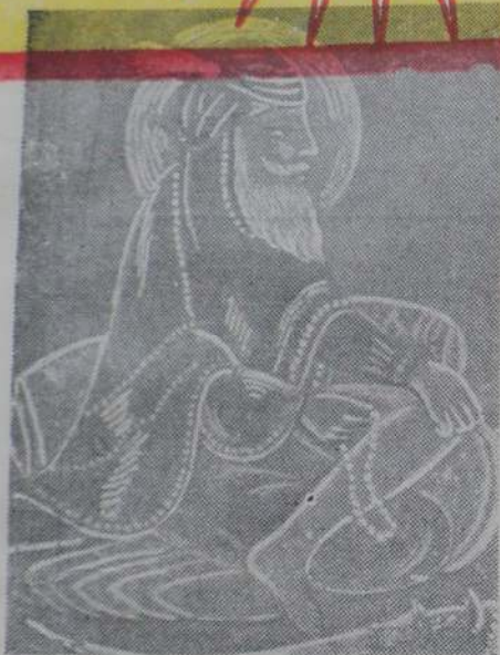
ਬਾਬਾ ਸਾਹਿਬ ਸਿੰਘ ਜੀ ਪਿਉ ਗੋਦੀ ਦੀ ਆਰੰਭਤਾ ਪਿਓ ਦਾਦੇ ਜੇਵੇਹਾ ਪੋਤ੍ਰਾ ਪਰਵਾਣ ।