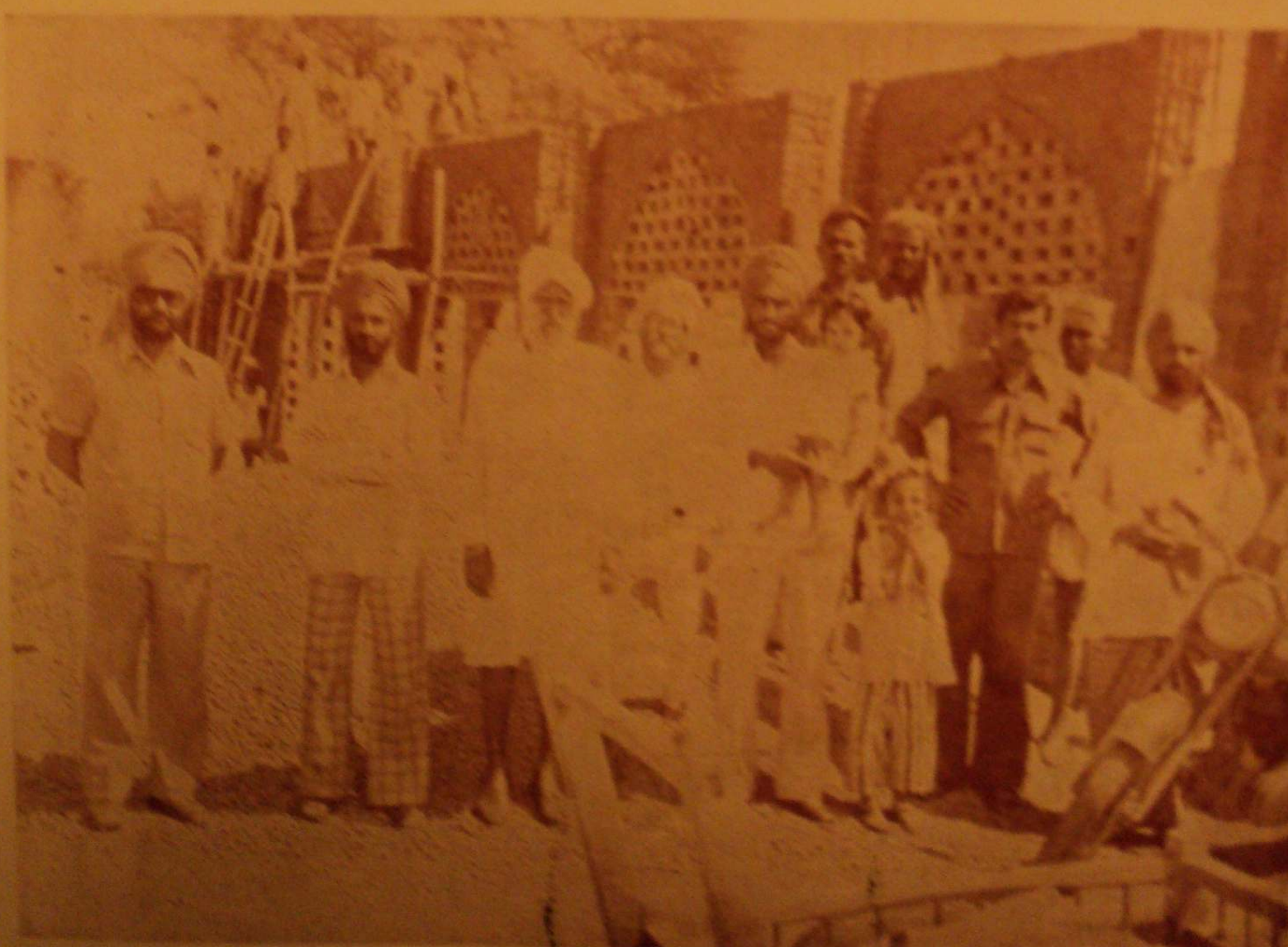
ਦਮਦਮਾ ਅਸਥਾਨ ਮਨਸੂਰਾ ਵਿਖੇ ਉਸਰ ਰਹੀ ਦਰਸ਼ਨੀ ਡਿਊਟੀ ਦਾ ਦ੍ਰਿਸ਼ ।