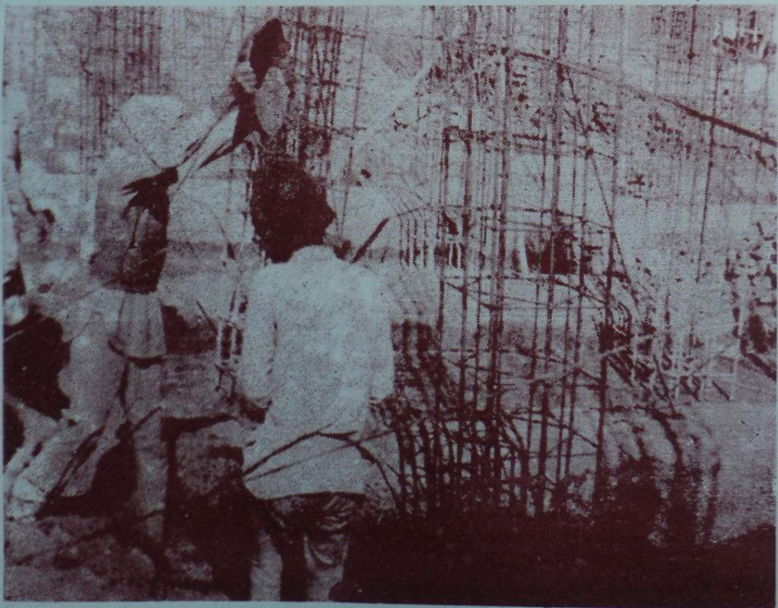
ਦਰਸ਼ਨੀ ਡਿਉਢੀ, ਫਰੀ ਹਸਪਤਾਲ; ੧ੳ ਪ੍ਰੈਸ ਦੀ ਇਮਾਰਤ ਸ਼ੁਰੂ, ਸੰਗਤਾਂ ਸੇਵਾ ਵਿਚ ਮਨਸ਼ੁਰਾਂ ਵਿਖੇ