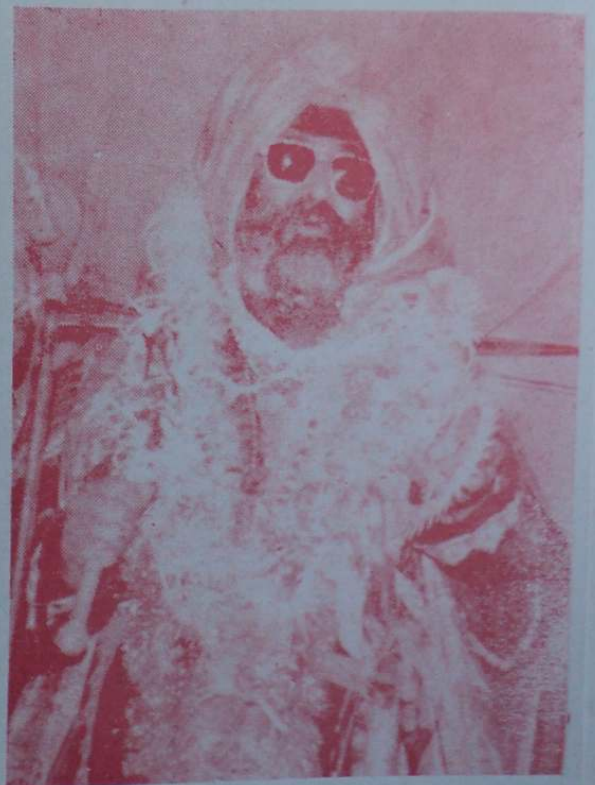
ਸ੍ਰੀ ਹਜ਼ੂਰ ਬਾਬਾ ਜੀ ਬੰਬਈ ਦੇ ਦੀਵਾਨਾਂ ਵਿਚ ਪ੍ਰਚਾਰ ਕਰ ਰਹੇ ਹਨ। ਸੰਗਤਾਂ ਵਲੋਂ ਸ਼ਿੰਗਾਰੇ ਗਏ ਤੇ ਸਰੋਪਾਓ ਪੁਸ਼ਾਕ ਆਪ ਨੂੰ ਪਹਿਨਾਈ ਗਈ।