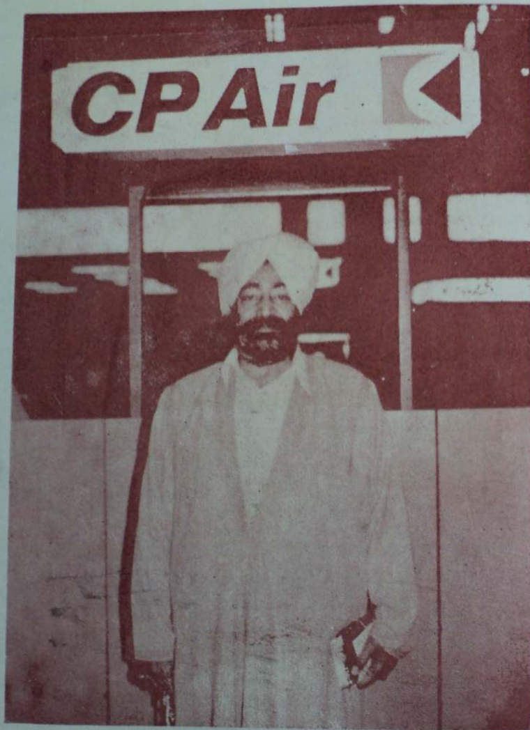
ਸ੍ਰੀ ਹਜ਼ੂਰ ਬਾਬਾ ਜੀ ਕੈਨੇਡਾ (Canada) ਵਿਖੇ