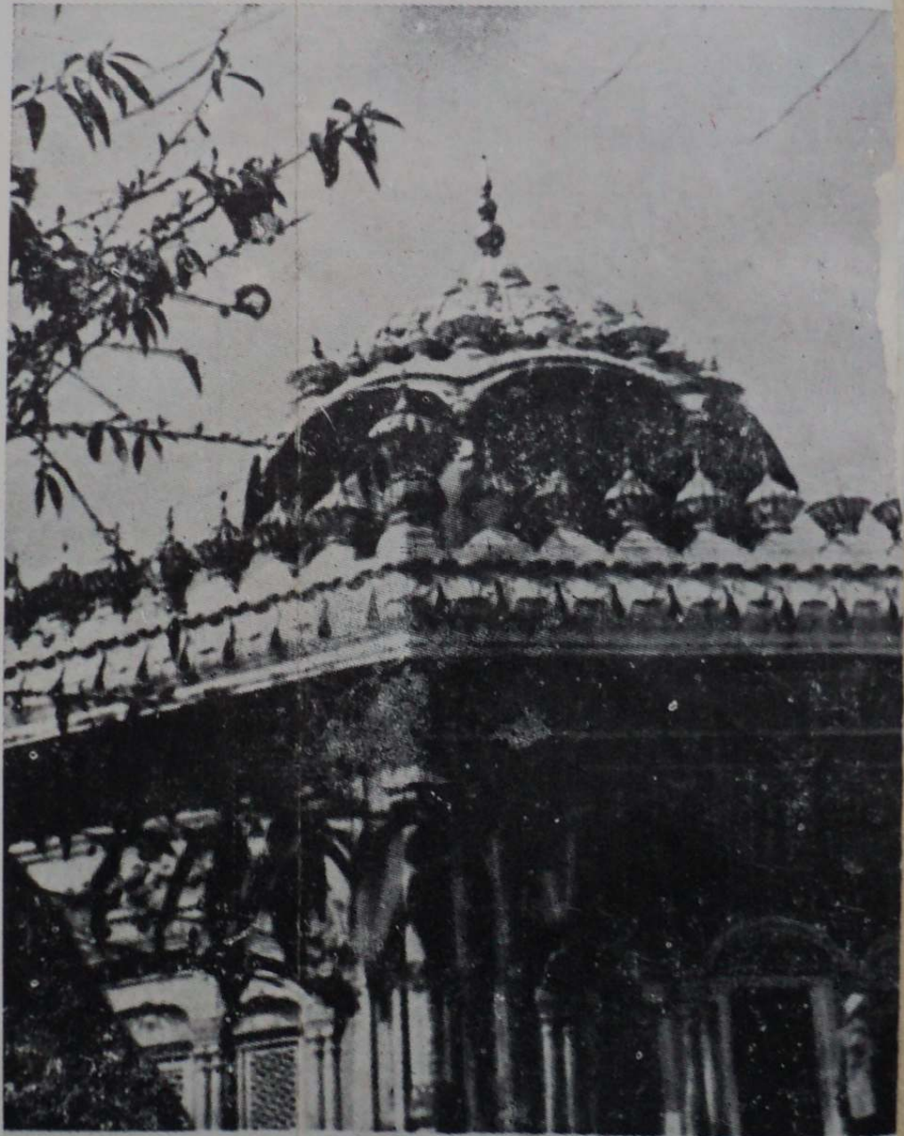
ਦਰਬਾਰ ਹਜ਼ੂਰ ਬਾਬਾ ਸਾਹਿਬ ਸਿੰਘ ਜੀ ਮਾਝਾ ਉਨੇ ਜਾਹਿਬ

ਦਰਬਾਰ ਸ੍ਰੀ ਹਜ਼ੂਰ ਬਾਬਾ ਸਾਹਿਬ ਸਿੰਘ ਜੀ ਉਨੇ ਸ ਹਿਬ ਵਿਖੇ ਜੋ ਬਾਬਾ ਸਾਹਿਬ ਸਿੰਘ ਜੀ ਨੇ ਆਪਣੇ ਸੇਵਕ ਸੰਤ ਭਾਈ ਬੀਰ ਸਿੰਘ ਜੀ ਨਿਰੰਗਾਬਾਦ ਵਾਲਿਆਂ ਕੋਲੋਂ ਆਪਣੀ ਜਿੰਦਗੀ ਵਿਚ ਹੀ ਨਿਸ਼ਾਨ ਕਾਇਮ ਕਰ ਦਿਤਾ ਸੀ। ਸੰਤ ਭਾਈ ਬੀਰ ਸਿੰਘ ਜੀ ਨਾਲ ਪ੍ਰਸੰਨ ਹੋ ਕੇ ਬਾਬਾ ਸਾਹਿਬ ਸਿੰਘ ਜੀ ਨੇ ਆਪਣੇ ਲੰਗਰ ਦੀਆਂ ਦੇਗਾਂ ਪ੍ਰਸੰਨ ਹੋ ਕੇ ਦੇਦਿਤੀਆਂ ਤੇ ਆਖਿਆ ਅੰਗਰੇਜ਼ ਆਉਣਗੇ ਸਾਡੇ ਕਿਲੇ ਵਾਹ ਢੇਰੀ ਕਰਨਗੇ। ਔਰ ਗੁਰੂ ਦੇ ਲੰਗਰ ਬੰਦ ਹੋਜਾਣਗੇ। ਆਪ ਮੇਰੇ ਅਨਿਨ ਭਗਤ ਹੋ ਮੇਰਾ ਗੁਰੂ ਦਾ ਲੰਗਰ ਜਾ ਕੇ ਨਿਰੰਗਾਬਾਦ ਚਲਾਉ। ਜਿਥੇ ਬਰਕਤ ਵਾਲੀਆਂ ਦੇਗਾਂ ਦਿਤੀਆਂ ਉਥੇ ਨਾਲ ਇਹ ਵੀ ਵਰ ਦਿਤਾ ਕਿ ਸੰਤ ਜੀ ਇਹ ਖੜੀਆ ਲੈ ਜਾਉ। ਮੇਰਾ ਖੀਸਾ ਹੋਵੇਗਾ ਆਪ ਦਾ ਹੱਥ ਹੋਵੇਗਾ। ਜਿਨੀ ਮਰਜੀ ਲੋੜ ਅਨੁਸਾਰ ਮਾਇਆ ਖੜੀਏ ਵਿਚ ਕਢ ਲਿਆ ਕਰੋ। ਆਪ ਦੇ ਵਰ ਦੇ ਅਧਾਰ ਤੇ ਇਸ ਸਮੇਂ ਸੰਤ ਭਾਈ ਬੀਰ ਸਿੰਘ ਦੀ ਸੰਪਰਦਾਏ ਦੇ ਅਨੇਕਾਂ ਲੰਗਰ ਮਾਝੇ ਔਰ ਮਾਲਵੇ ਦੀ ਧਰਤੀ ਤੇ ਚਲ ਰਹੇ ਹਨ। ਕਿਸੇ ਕਿਸਮ ਦੀ ਤੋਟ ਨਹੀਂ ਆਉਂਦੀ।