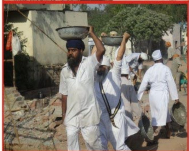
ਰਤਵਾੜਾ ਦੀ ਬਰਾਂਚ ਗੁ. ਈਸ਼ਰ ਪ੍ਰਕਾਸ਼ ਬਨੁੱਤ ਵਿਖੇ ਗੁਰਦੁਆਰਾ ਸਾਹਿਬ ਦੀ ਨਵੀਂ ਇਮਾਰਤ ਲਈ ਪੰਜਾਂ ਸੰਤਾਂ ਦੁਆਰਾ ਕਾਰਸੇਵਾ ਦੀ ਅਰੰਭਤਾ ਦੇ ਵੱਖ ਵੱਖ ਦ੍ਰਿਸ਼।