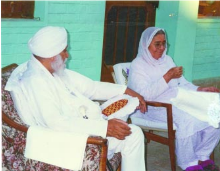
ਪਰਮ ਸਤਿਕਾਰਯੋਗ ਬੀਜੀ ਅਤੇ ਸੰਤ ਮਹਾਰਾਜ ਰਤਵਾੜਾ ਸਾਹਿਬ ਵਿਖੇ

ਮੈਂ ਖਿੱਚ ਖਾ ਗਿਆ ਓਨ੍ਹਾਂ ਨੂੰ ਦੇਖ, ਵੈਸੇ ਓਥੇ ਮੈਂ ਜਾਂਦਾ ਨਹੀਂ ਸੀ, ਕਿਉਂਕਿ ਮੈਂ ਬਹੁਤ ਸਾਰੇ ਸੰਤਾਂ ਕੋਲ ਬਚਪਨ ਤੋਂ ਹੀ ਘੁੰਮਦਾ ਸੀ। ਮੈਨੂੰ ਤਿੰਨ ਚਾਰ ਸਾਲ ਦੇ ਨੂੰ ਪਤਾ ਸੀ ਕਿ ਸੰਤ ਕੀ ਹੁੰਦੇ ਨੇ, ਓਨ੍ਹਾਂ ਦੇ ਪ੍ਰਭਾਵ ਮੇਰੇ