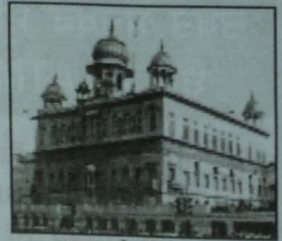
ਗੁਰਦੁਆਰਾ ਸੀਸਗੰਜ ਸਾਹਿਬ ਦਿੱਲੀ