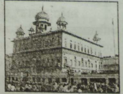
ਗੁਰਦੁਆਰਾ ਸੀਸਗੰਜ ਸਾਹਿਬ ਦਿੱਲੀ