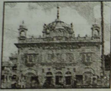
ਤਖਤ ਸੱਚਖੰਡ ਸ੍ਰੀ ਹਜ਼ੂਰ ਸਾਹਿਬ ਨਾਂਦੇੜ